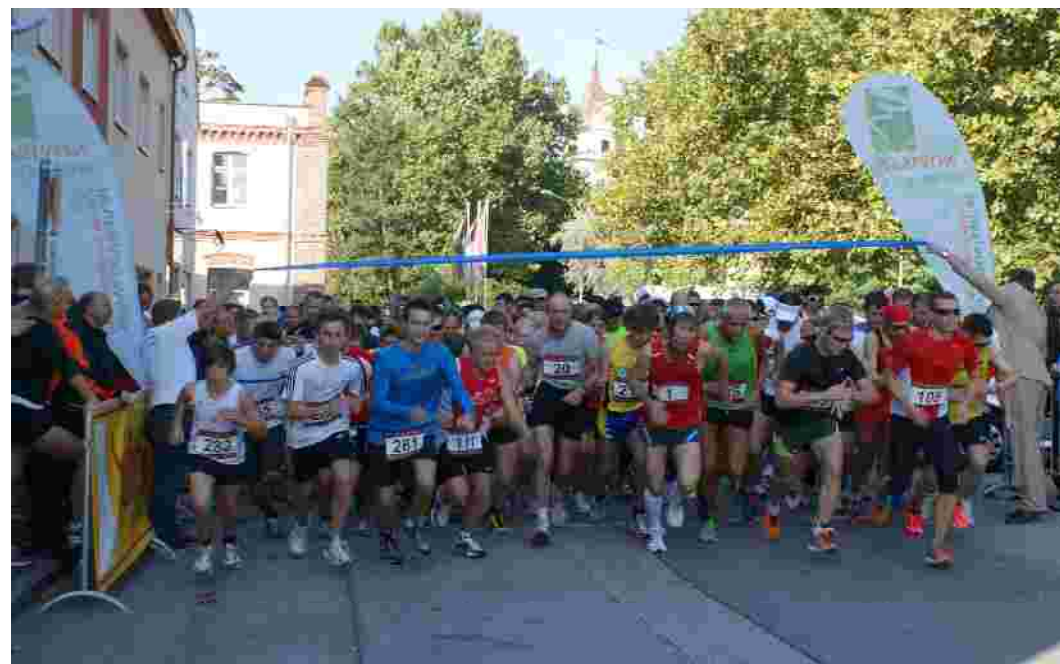
Foto: 10.Int. Ebreichsdorfer Stadtlauf 18.09.2011